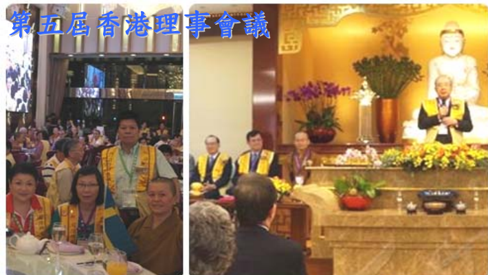
第五屆香港理事會議